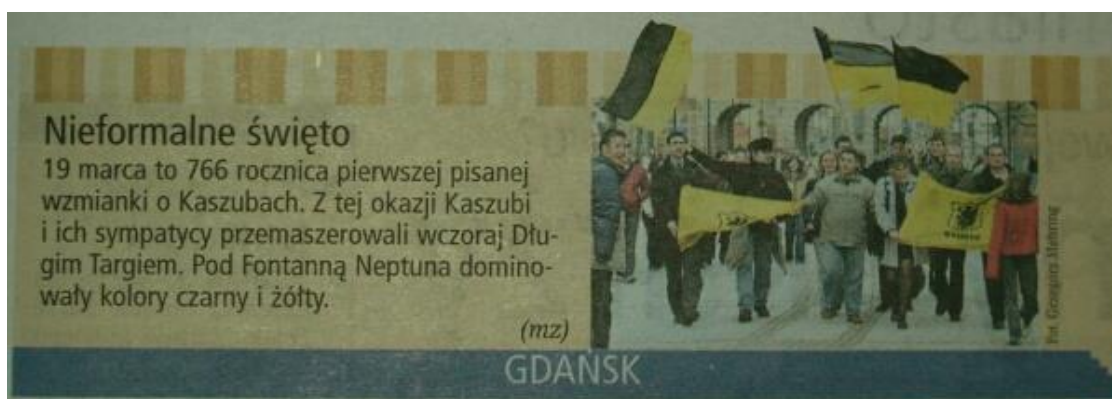
Obchody Dnia Jedności Kaszubów. Gdańsk, 19 marca 2004 r. – Notatka w Dzienniku Bałtyckim