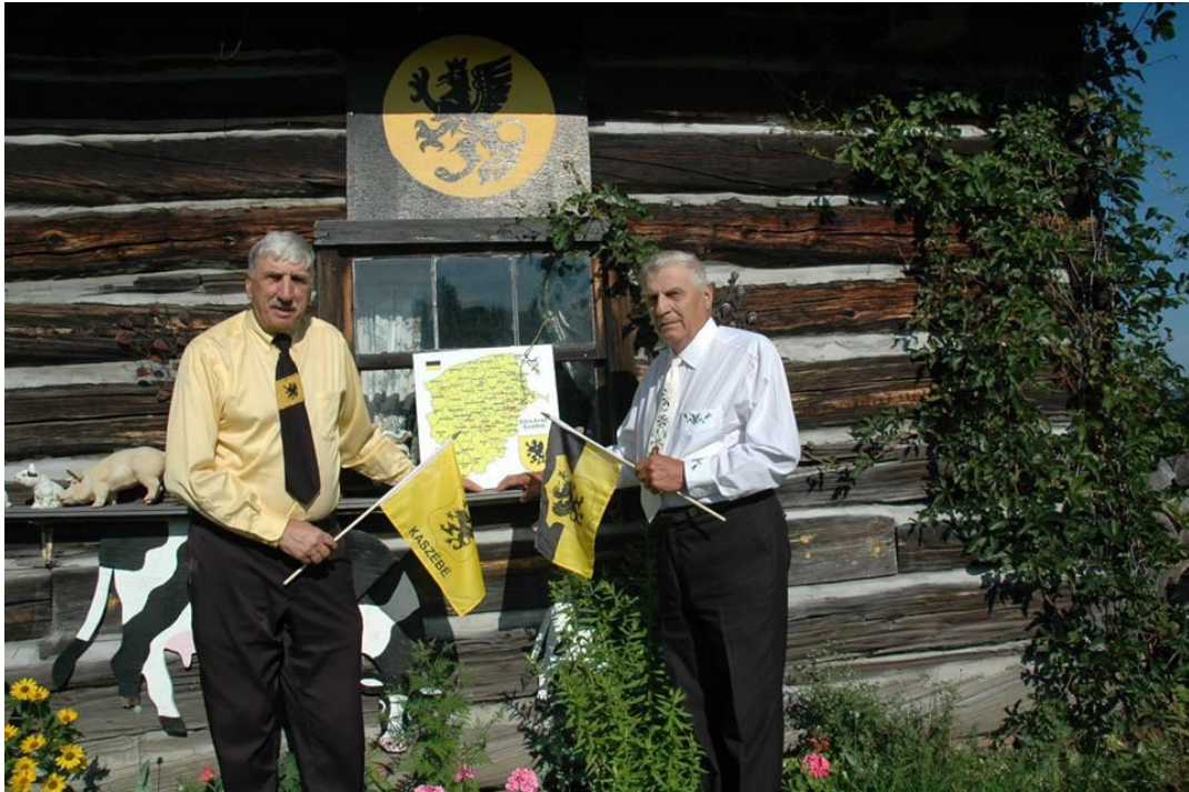
Święto Flagi Kaszubskiej u kanadyjskich Kaszubów (2013)