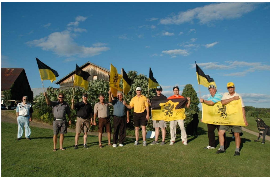
Święto Flagi Kaszubskiej w Kanadzie, w prowincji Ontario (2012)