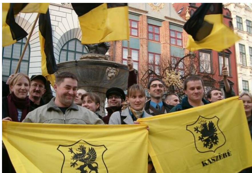
Obchody Dnia Jedności Kaszubów. Gdańsk, 19 marca 2004 r.